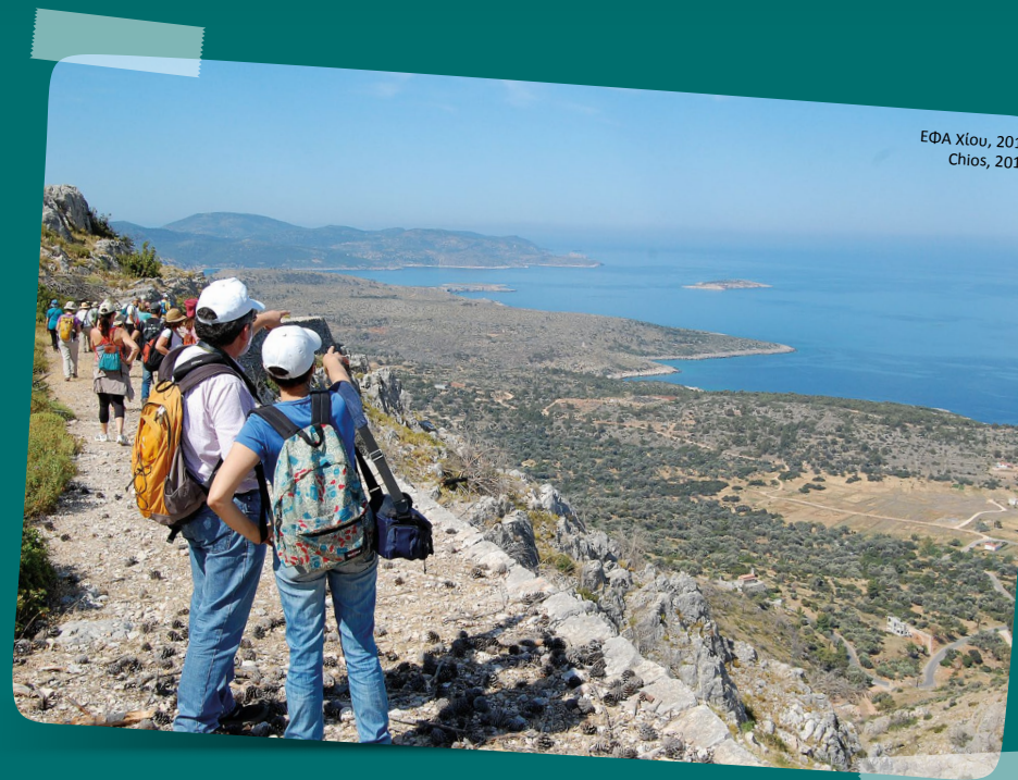
ΕΦΑ Χίου, 2016 Chios, 2016