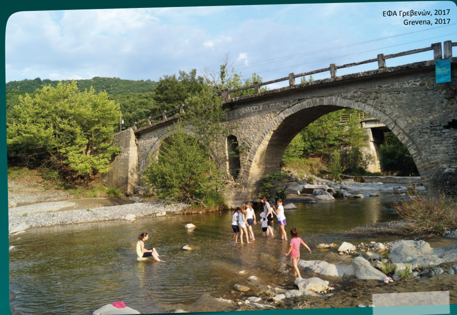
ΕΦΑ Γρεβενών, 2017 Grevena, 2017